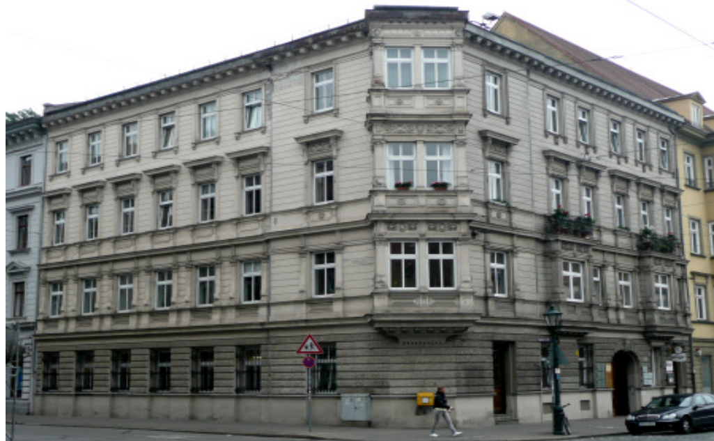
Lage: Im Zentrum Augsburgs. Maximilianstraße 50.