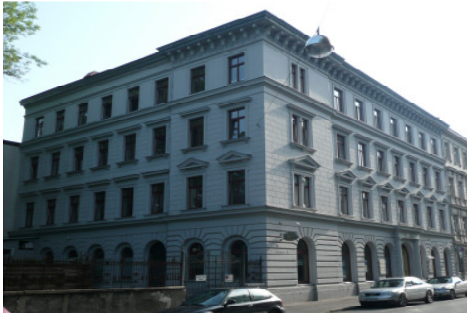
Lage: Im Zentrum Augsburgs. Hallstraße 4.